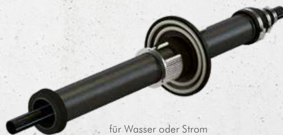
für Wasser oder Strom