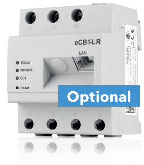
Mit Strom-Klappwandlern bis 1000 A

Unser Smartmeter eCB1-MP+ ermöglicht Ihnen reines PV-Überschussladen und verhindert gleichzeitig eine Überlastung Ihres Hausanschlusses, dank unseres dynamischen Echtzeit-Lastmanagements.