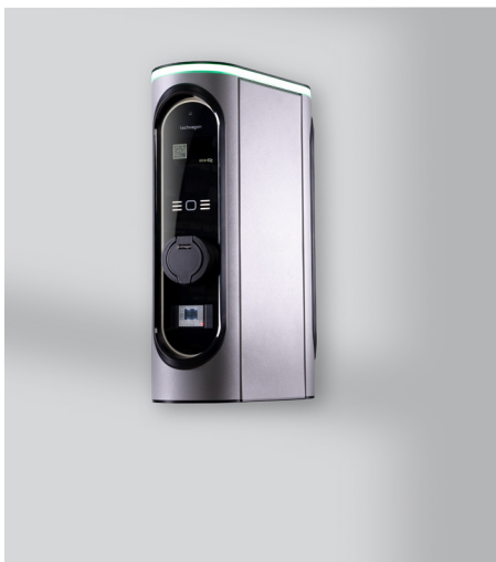
Mit Ladedose als Standard