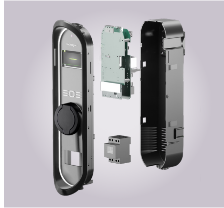
Technagon Lademodul (ERK)