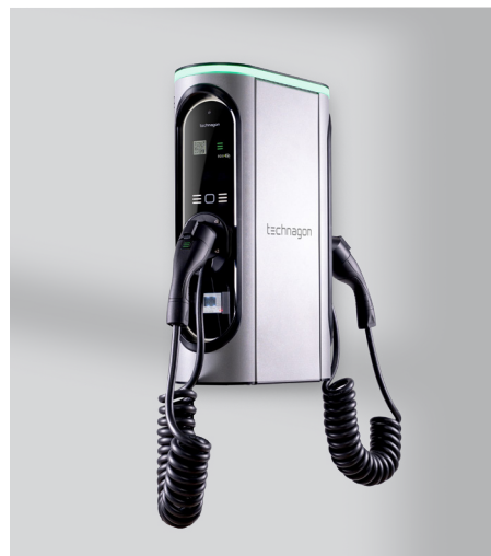
Mit Spiralkabel als Option