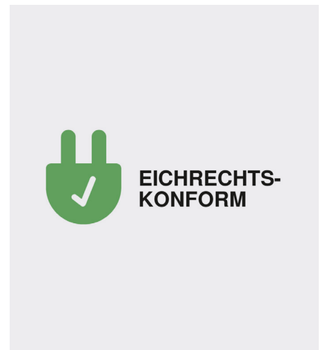
Eichrechtskonform (ERK) als Standard