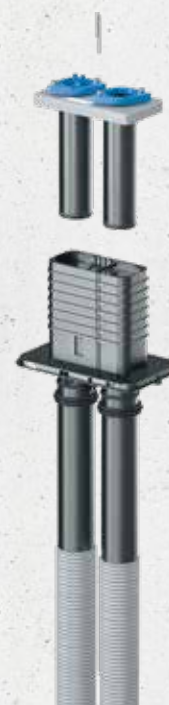
Quadro-Sicura® Nova R2