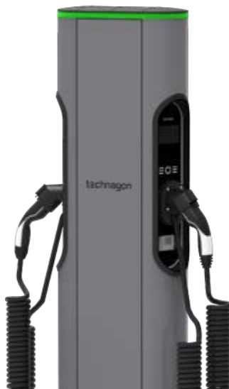
mit AGK (angeschlagenem Kabel) als Option