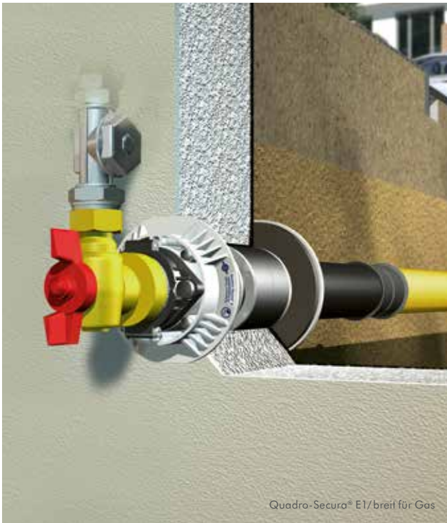
Quadro-Sicura® E1/breit für Gas