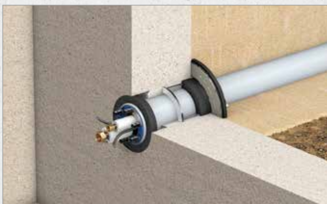
Systematische Darstellung: Einbau Quadro-Secura® Quick/H in Kombination mit Curaflex Nova® Uno/M/Z

BOHRUNGEN IN DEN GÄNGIGSTEN WANDARTEN MIT ABDICHTUNG NACH DIN 18533 W2.1-E (SCHWARZE WANNE) UND WU-BETONKERNBOHRUNGEN (WEISSE WANNE)